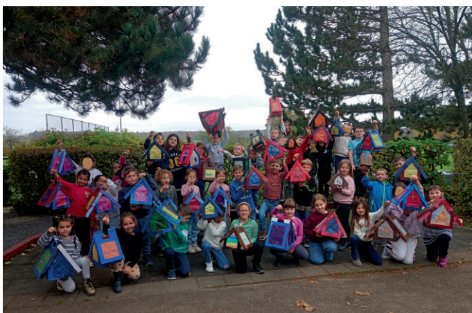
Erst- und Zweitklässler mit ihren Laternen

Die Kinder waren enttäuscht, dass das schlechte Wetter dem Umzug einen Strich durch die Rechnung machte. Nun leuchten die Laternen in den Kinderzimmern.