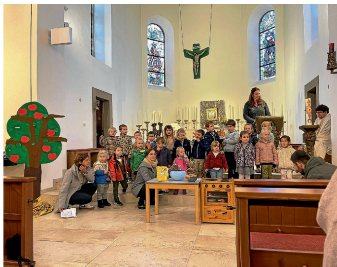
Rollenspiel der Kinder vom Apfel

Diesen Saft und leckeren selbst gebackenen Apfelkuchen gab es im Anschluss an den anregenden Gottesdienst. Wir danken allen, die zum Gelingen dieser schönen Erntedankfeier beigetragen haben. Es hat uns große Freude bereitet.